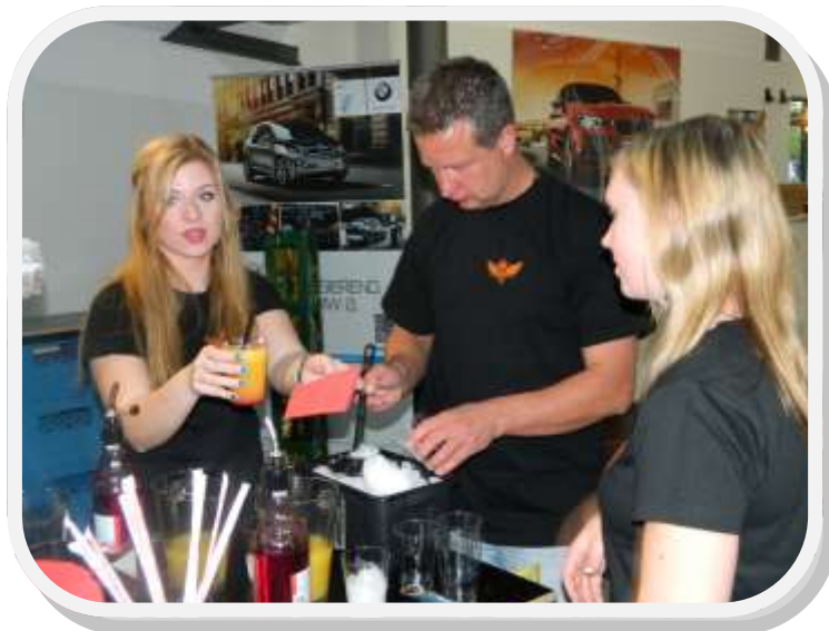
Fleißige Helfer bei der Party 2014 in der Schutzengel-Bar